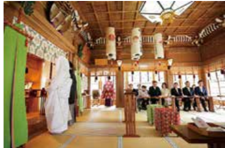
▲神様に結婚を報告する『誓詞奏上』