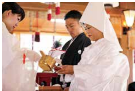
▲神様の前で新郎新婦が盃を交わし、夫婦の契りを結ぶ『三々九度の盃』