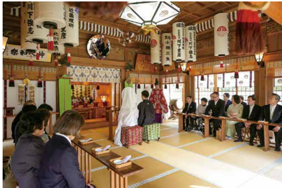
▲儀式がすべて滞りなく終わり、斎主に合わせて御神前に向かい一礼をして式が終了