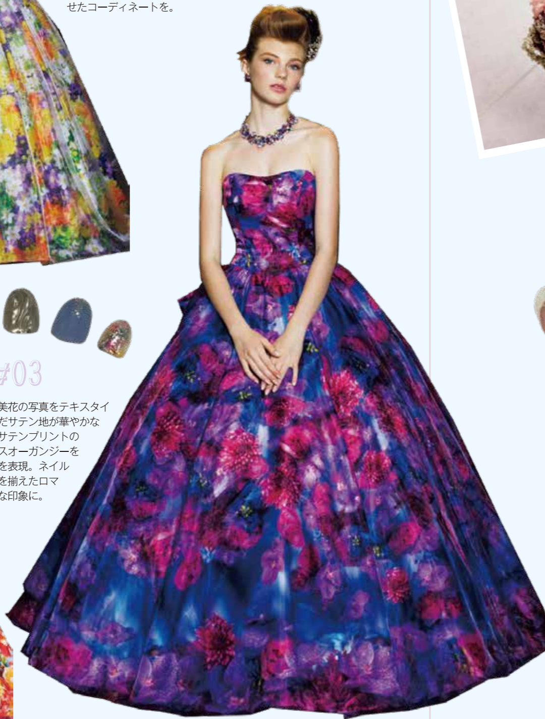
2. ドレス全て M/mika ninagawa (ウエディングコスチュームHIROTA)

色鮮やかな蜷川美花の写真をテキスタイルに落とし込んだサテン地が華やかな印象を与える。サテンプリントの上に透明なグラスオーガンジーを重ねて3D効果を表現。ネイルもニュアンスを揃えたロマンティックな印象に。